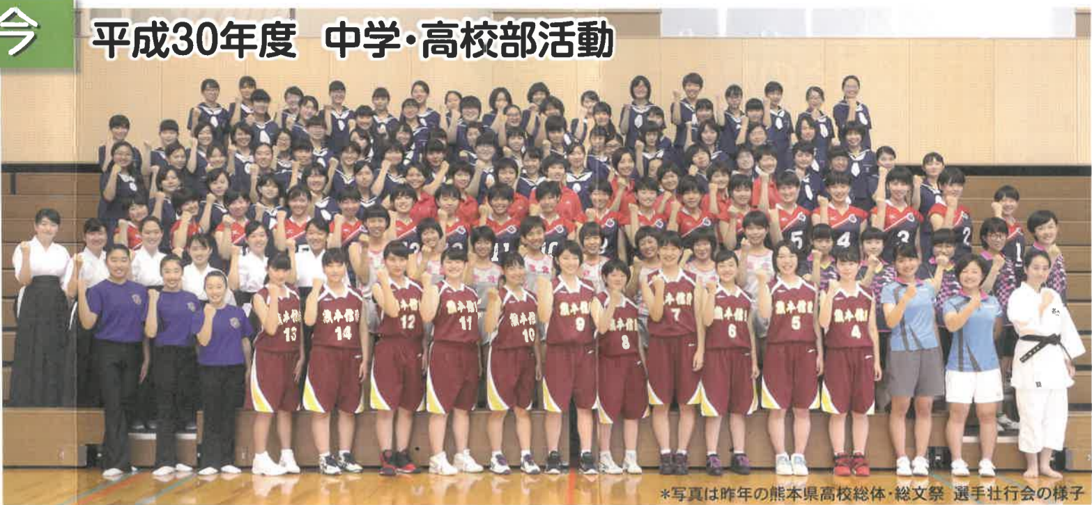
*写真は昨年の熊本県高校総体・総文祭 選手壮行会の様子