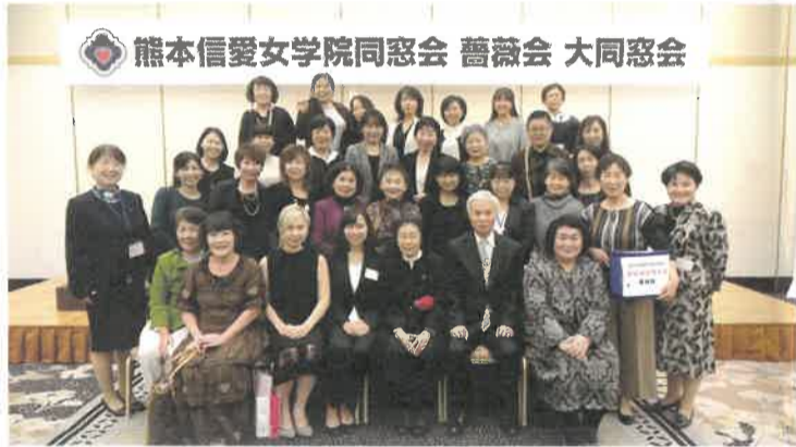
信愛だーいすき隊