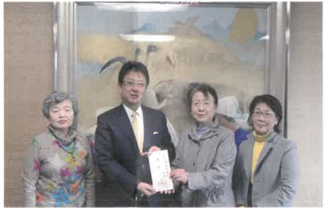
大西熊本市長に寄付を届けました